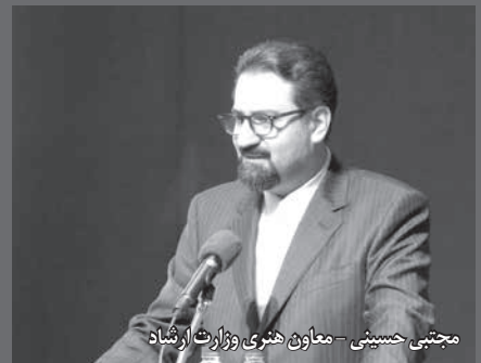
مجتبی حسینی - معاون هنری وزارت ارشاد