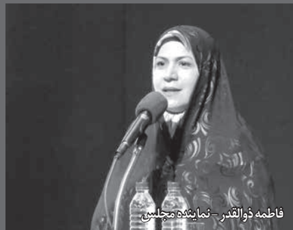
فاطمه ذوالقدر - نماینده مجلس