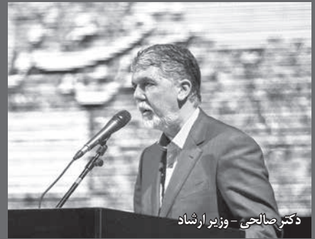
دکتر صالحی - وزیر ارشاد